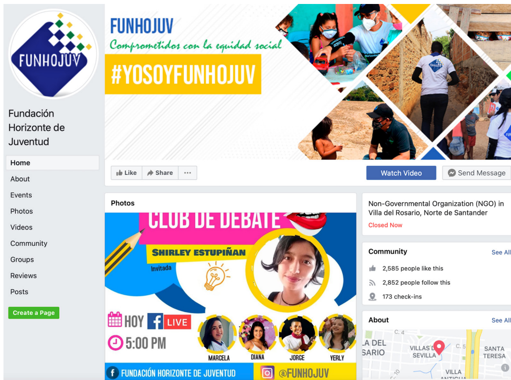
Figura 7. Liderazgo migrante y juvenil: página de Facebook de la Fundación Horizonte de Juventud