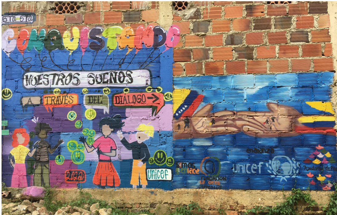
Figura 1. Representación de la resistencia a la xenofobia: mural de Tejedores de Paz en uno de los barrios periféricos de Cúcuta mostrando la solidaridad colombo-venezolana