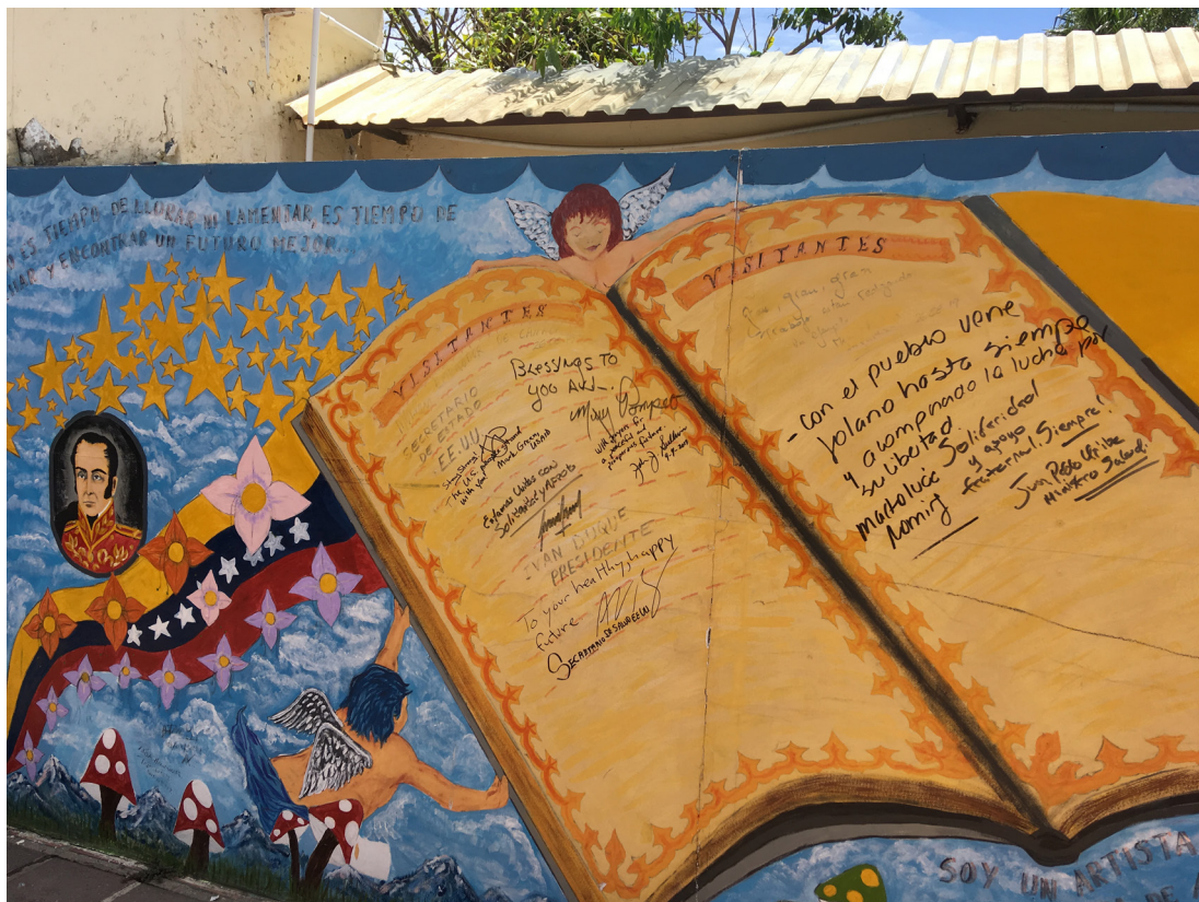
Figura 5. La frontera humanitaria como lugar de batalla geopolítica. Oficiales nacionales e internacionales expresan su solidaridad con los proyectos de atención a los migrantes, incluyendo a los entonces presidente y ministro de Salud de Colombia de ese momento, además de funcionarios del Departamento de Estado y la Agencia para el Desarrollo Internacional (USAID) de los Estados Unidos

La Fundación también promovió hogares de paso en la frontera, en los cuales los migrantes recibían tratamiento médico y alimentos. Los hogares recibían visitas de alto rango del cuerpo diplomático, incluyendo al secretario de Estado norteamericano Mike Pompeo e Ivanka Trump, hija del presidente de Estados Unidos, Donald Trump (figura 5). Horizonte de Juventud es representativo por cómo con frecuencia las personas locales y las organizaciones de base, en realidad, hacen el trabajo humanitario; mientras que instituciones como Unicef o el Departamento de Estado norteamericano vinculan su nombre a estas para aumentar su reputación política y adelantar sus proyectos, como en esta frontera humanitaria, que se ha convertido en un campo de batalla geopolítico para la hegemonía capitalista estadounidense. En concordancia con el régimen de ayuda humanitaria del norte global (Weizman, 2011), tales maniobras diplomáticas buscan atemperar ciertos tipos de sufrimiento