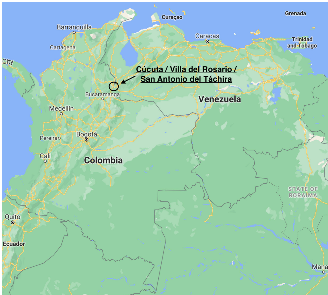
Figura 3. Cúcuta, Villa del Rosario y San Antonio en la frontera colombo-venezolana

amplias (Van Roekel & De Theije, 2020). No obstante, los migrantes también organizan movimientos colectivos. Al investigar la práctica territorial experimentada, la geopolítica decolonial feminista constituye un instrumento para resaltar dichas luchas. Dos organizaciones de esta clase que se encuentran activas en la frontera entre Colombia y Venezuela: Tejedores de Paz y la Fundación Horizonte de Juventud (figura 3).