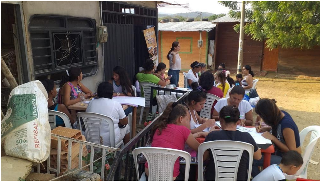
Figura 6. Movimientos migrantes internacionales con enfoque de género: taller de empoderamiento de mujeres de Tejedores de Paz