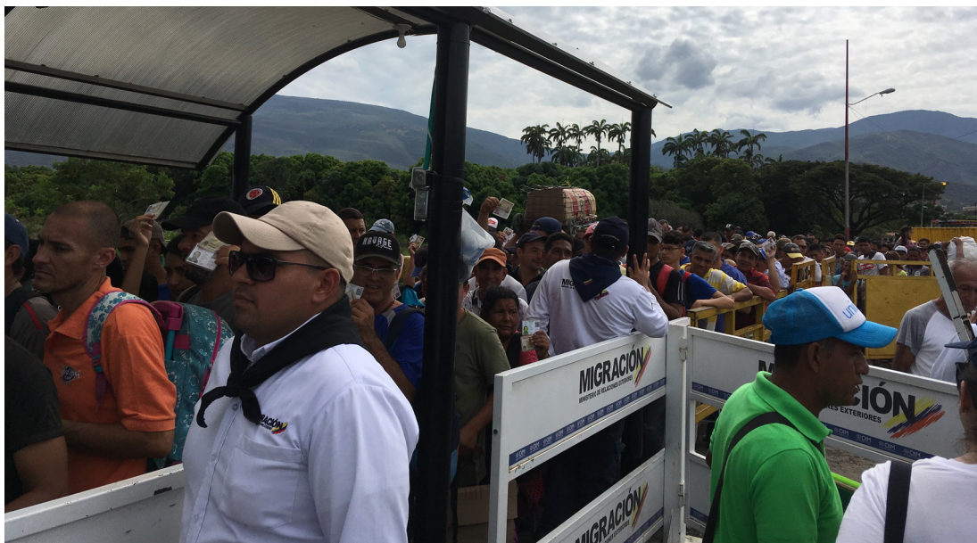
Figura 4. Cruces de frontera: el puente Simón Bolívar

Por otro lado, Horizonte de Juventud es una fundación dedicada al empoderamiento de jóvenes que trabaja en la primera línea de la ayuda humanitaria para migrantes en Villa del Rosario. El punto de frontera formal más atravesado entre Venezuela y Colombia es el puente Simón Bolívar que conecta la ciudad venezolana de San Antonio con Villa del Rosario (figura 4). En 2018, voluntarios de Horizonte iniciaron una coordinación impromptu de las colas de control de migración en las cuales los inmigrantes se ponían en fila para que les sellaran sus pasaportes, asistiendo a las personas mayores y a las mujeres con niños pequeños, a fin de llevar a los más vulnerables a los primeros puestos de la cola. Por solicitud del fundador y director ejecutivo de Horizonte, Jony Cifuentes, el Fondo de las Naciones Unidas para la Infancia (Unicef) finalmente otorgó subvenciones a la organización para continuar desarrollando esa labor en nombre de Unicef.